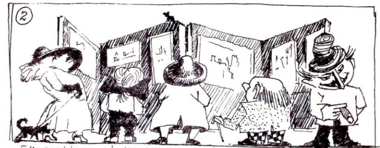
Ekspertisen i sving.