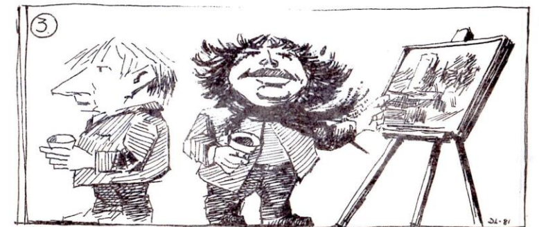
Nerdrum snakker om bilder mens formannen leter etter mere vin. 6.