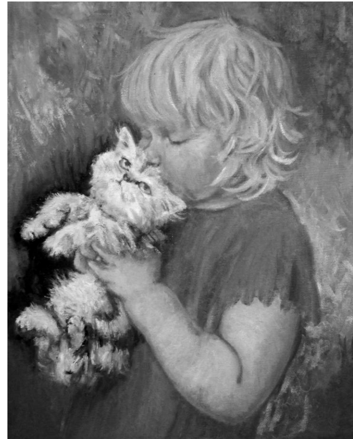
KARIN WÆHLE FRA UTSTILLINGEN «BARNDOM»

Filmkveld kl 19.30, kr 100,-, inkl. kaffe/vin.