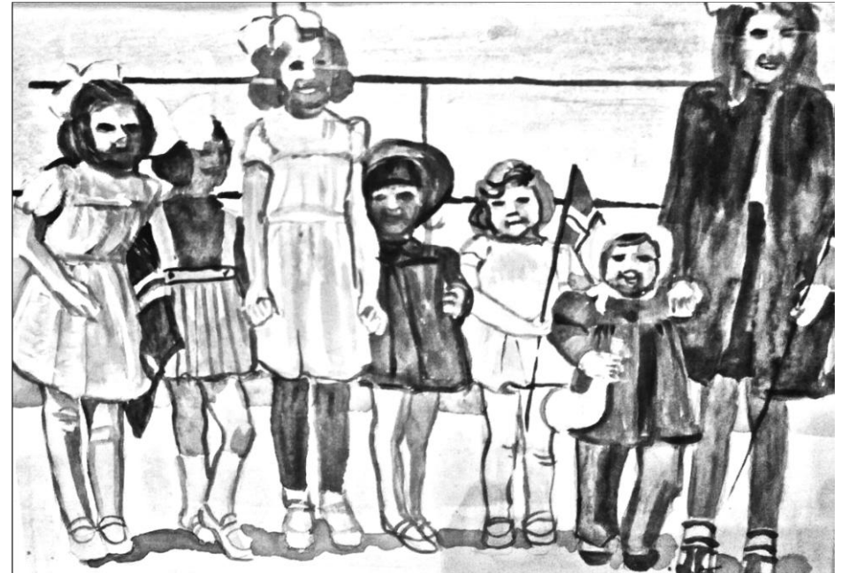
BILDE FRA SOMMERFESTENS KONKURRANSE MED TEMA «BARNDOM»