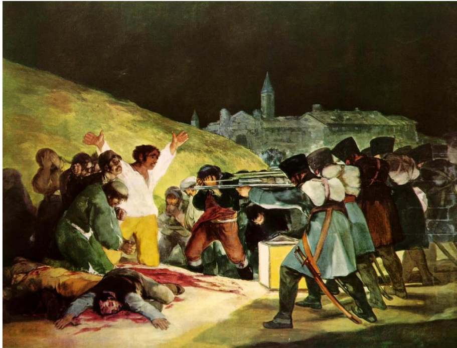
Francisco de Goya "3 mai 1808"