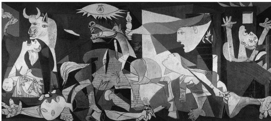
Pablo Picasso "GUERNICA 1937"